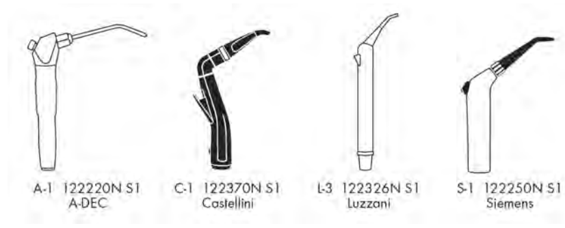
A-1 122220N S1 A-DEC