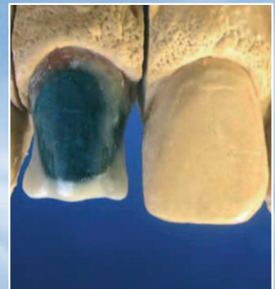
Verifica degli spessori e lavoro pronto per l'imperatura

Thickness check and work ready for spruing