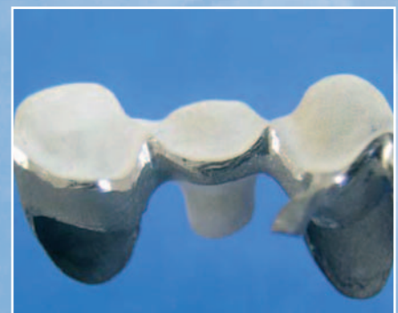
Strutture realizzate in Underwax e trasformate in lega

Frameworks carried out with Underwax and converted into metal