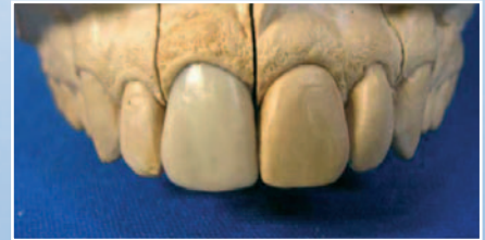
Elemento modellato su cappetta rigida in Underwax Nobil Metal

Caution: photopolymerisable systems with UV light emission do not polymerise the product. Upon completion of the operation, carefully re-close the syringe and store away from light and heat sources.